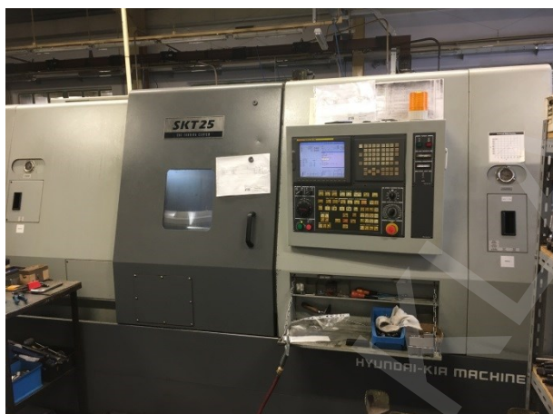
CNC soustruh HYUNDAI-KIA SKT 25