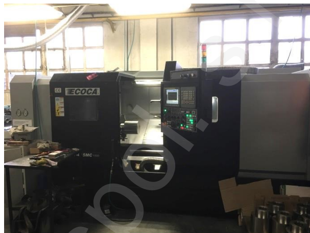
CNC soustruh ECOCA MT-415MC