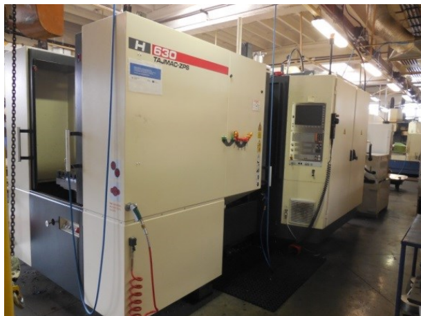
CNC obráběcí centrum ZPS Tajmac H 630